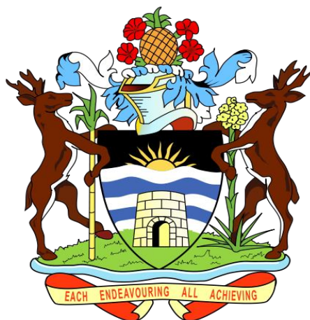
安提瓜和巴布达政府