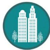
International Business Center-IBC