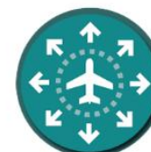
Transportation and logistics industry