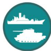
National defense industry