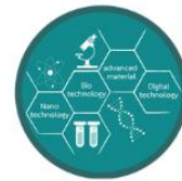
Targeted Technology Development