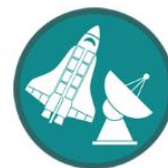
Aviation, aerospace, and space industry