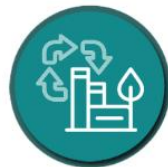
Environment management and renewable energy