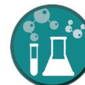
Petrochemical and chemical industry