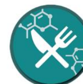
Agriculture, food, and biotechnology industry