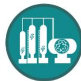
Direct and significant supporting industries for the circular economy