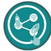
Management of Technology Innovation and Startup Ecosystem