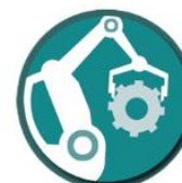
Automation and robotics industry