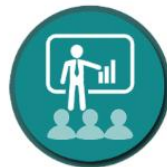
Human resource development in science and technology