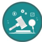
Alternative Dispute Resolution Service